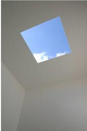
James Turrell Skyspace (ongoing project)