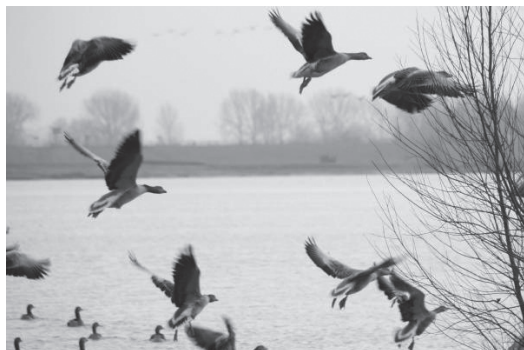
De Honswijkerplas bij Tull en 't Waal 2024